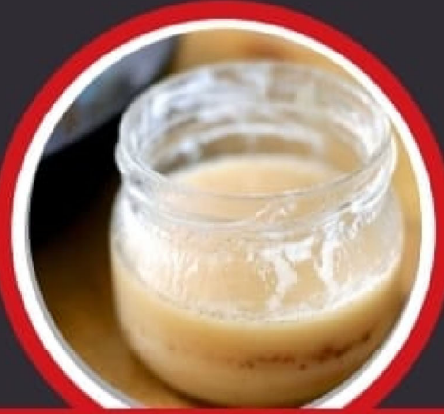
לאזט די שמאלץ זיך אויסקילן און פארגליווערן, דאן ווארפט עס אוועק אין די גארבידזש

די בעסטע וועג צו פארמיידן די סארט סוער בעקאפס איז, מען זאל זיך צוריק האלטן פון אויסגיסן די שמאלץ אין סינק אדער ביהכ"ס , און אנשטאט דעם זאל מען עס לאזן זיך אויסקילן אין א קאנטעינער, ווען עס איז שוין אויסגעקילט און פארגליווערט, קען מען עס גרינגערהייט אוועקווארפן אין די גארבידזש און עס מאכט נישט אן קיין באזונדערע שמוץ.